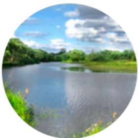
Легкий порыв ветра